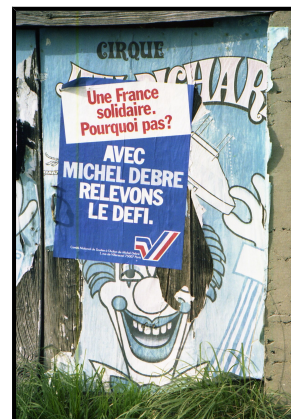
Maladresse de collage d'affiches électorales en 1981... ou fourberies d'un dit "Scapin" opposant

... est-ce cela tout ? Vous voilà bien embarrassé... C'est bien la question se tant alarmer. N'avez-vous point de honte de demeurer court à si peu de chose ? Que diable, vous voilà grand et gros et vous ne saurois trouver dans votre teste, forger en votre esprit quelques ruses galante, quelque honneste petit stratagème, pour ajuster vos affaires ? Fy. Peste soit du Butor !