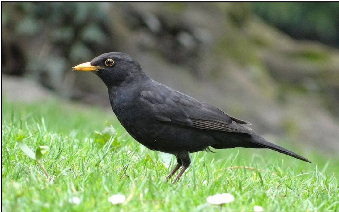
Un superbe " Monsieur " Merle

Personnellement je vois bien l'équivalent d'un genou inversé par rapport aux humains :